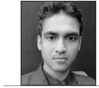
ସୁଦେଷୁ କୁମାର ବଳ

ନିର୍ମିତ । ଉପର ଦୁଇ ଭୁଜ ମଧ୍ୟରୁ ଦକ୍ଷିଣ ଭୁଜରେ ଖଡ୍ଗ ଓ ବାମ ଭୁଜରେ ଖର୍ଚ୍ଚିତ ଧାରଣା କରିଛନ୍ତି ଏବଂ ତଳ ଭୁଜ ଦୁଇଟି ମଧ୍ୟରୁ ଦକ୍ଷିଣ ଭୁଜରେ କରମାଳା ଓ ବାମ ଭୁଜରେ ଶିଶୁ କୃଷ୍ଣଙ୍କୁ କୋଳରେ ଧରିଛନ୍ତି । ଏହା ଏକମାତ୍ର ଶକ୍ତିପୀଠ, ଯେଉଁଠି ମା' କାଳୀ ଶ୍ରୀକୃଷ୍ଣଙ୍କୁ କୋଳରେ ଧରିଛନ୍ତି । ତେବେ ସିଂହ ପୃଷ୍ଠରେ ବିରାଜିତ ରହି କୋଳରେ ଶିଶୁ କୃଷ୍ଣଙ୍କୁ ଧରିଥିବାରୁ ଏହାକୁ