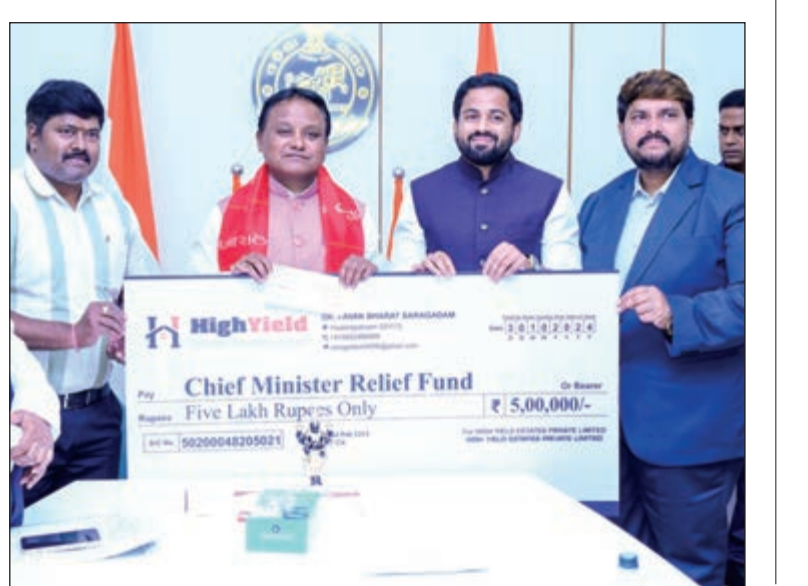
ମୁଖ୍ୟମନ୍ତ୍ରୀଙ୍କୁ ସହାୟତା ପ୍ରଦାନ କରୁଥିବା ସଂସ୍ଥା ମୁଖ୍ୟମାନଙ୍କ ସହିତ

ଭୁବନେଶ୍ୱର, ୩୦/୧୦/୨୦୨୪: ବାଚ୍ୟା 'ଦାନା' କ୍ଷତିଗ୍ରସ୍ତଙ୍କ ସହାୟତା ଓ ବାଚ୍ୟା ପରବର୍ତ୍ତୀ ପୁନରୁଦ୍ଧାର କାର୍ଯ୍ୟ ପାଇଁ ଆଜି ଲୋକସେବା ଭବନ ଠାରେ ବିଭିନ୍ନ ସଂସ୍ଥା ମୁଖ୍ୟମନ୍ତ୍ରୀଙ୍କ ରିଲିଫ ଫଣ୍ଡ (ସିଏମ୍ଆରଏଫ୍)କୁ ସହାୟତା ପ୍ରଦାନ କରିଛନ୍ତି। ବାଚ୍ୟା ସହାୟତା ପ୍ରଦାନ କରିଛନ୍ତି। ବାଚ୍ୟା ସହାୟତା ପ୍ରଦାନ କରିଛନ୍ତି। ବାଚ୍ୟା ସହାୟତା ପ୍ରଦାନ କରିଛନ୍ତି।