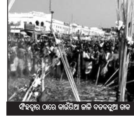
ସିଂହଦ୍ୱାର ଠାରେ କାର୍ତ୍ତବିଆ ଜାଳି ବଡ଼ବଡ଼ୁଆ ତାକ

ପୁରୀର ବର୍ଷା ଅନୁଯାୟୀ, ମହାଭାରତ ଯୁଦ୍ଧରେ ନିହତ ହୋଇ ମହାବୀରୀ କର୍ଣ୍ଣ ସ୍ୱର୍ଗଲୋକକୁ ଗମନ କରିଥିଲେ । ମାତ୍ର ସେଠାରେ ସେ କ୍ଷୁଧାର୍ତ୍ତ ହୋଇ ଖାଦ୍ୟ ମାଗିବାରୁ ତାଙ୍କୁ ଖାଦ୍ୟ ବଦଳରେ ସୃଷ୍ଟି ଦିଆଗଲା । ଏହାର କାରଣ ସ୍ୱରୂପ ତାଙ୍କୁ କୁହାଗଲା ଯେ ମର୍ତ୍ତ୍ୟଲୋକରେ ସେ ବହୁ ସୃଷ୍ଟିକର କରିଛନ୍ତି । ମାତ୍ର 'ଅନୁତ' କରି ନାହାନ୍ତି । ଅନୁ ପାଇବା ପାଇଁ ମର୍ତ୍ତ୍ୟଲୋକକୁ ଫେରି କ୍ଷୁଧାର୍ତ୍ତ ଅନୁତନ କରିବାକୁ ପଡ଼ିବ । ସର୍ବ ଅନୁଯାୟୀ, ମହାବୀରୀ କର୍ଣ୍ଣ ମହାଲକ୍ଷ୍ମୀ ଅମାବାସ୍ୟା ଦିନ ମର୍ତ୍ତ୍ୟଲୋକକୁ ଆସି ଏଠାରେ ଏକ ମାସ ଅବସ୍ଥାନ କରି ଅନୁତନ କରିଥିଲେ ଓ ଦୀପାବଳି ଅମାବାସ୍ୟା ଦିନ ସ୍ୱର୍ଗଲୋକକୁ ଫେରି ଯାଇଥିଲେ । ସେହି ସ୍ମୃତିରେ ବଡ଼ବଡ଼ୁଆ ତାକ ଓ ଦୀପାବଳି ଉତ୍ସବ ପାଳନ କରାଯାଇଥାଏ ।