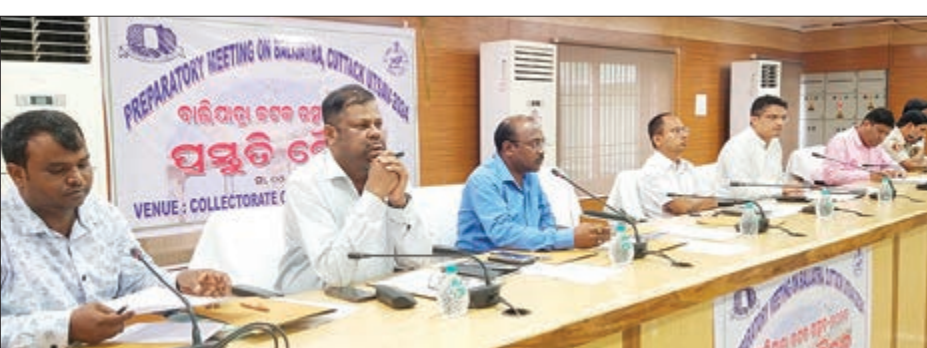
କରିବା ସହ ଉତ୍ତମ ସମ୍ପଦ ରକ୍ଷା ଉପରେ ଗୁରୁତ୍ୱରୋପ କରିଥିଲେ । କିଲ୍ଲାପାଳ ଏବଂ କିଲ୍ଲା ଗତବର୍ଷର ଭୁଲଭୁଲିକୁ ସୁଧାରିବାକୁ ପ୍ରୟାସ କରାଯିବା ଉପରେ ଗୁରୁତ୍ୱ ଦିଆଯିବ ବୋଲି କହିଛନ୍ତି । ବୈଠକରେ

କଟକ, ୪।୯/ଏନ୍-ଏନ୍-ଏ: କଟକ କିଲ୍ଲା ତଥା ରାଜ୍ୟର ପ୍ରାଚୀନ କଳା, ହସ୍ତଶିଳ୍ପ, ଫାଷ୍ଟି ଏବଂ ସାମୁଦ୍ରିକ ଐତିହ୍ୟକୁ ପ୍ରଦର୍ଶନ କରିବା ଉଦ୍ଦେଶ୍ୟରେ ଚଳିତବର୍ଷ ନଭେମ୍ବର ୧୫ରୁ ୨୨ତାରିଖ ପର୍ଯ୍ୟନ୍ତ ବାଲିଯାତ୍ରା ଅନୁଷ୍ଠିତ ହେବ । କିଲ୍ଲାପାଳଙ୍କ ସଂଭାବନା