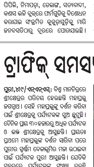
ପୁରୀ, ୪।୯/ଏନ୍-ଏନ୍-ଏ: ପୁରୀ କିଲ୍ଲାରେ କୁକୁଡ଼ାକୁ ବାତପୁ ପକେଟିଲ୍ ଚିହ୍ନିତ ହେବା ପରେ ରାପିଡ୍ ଆକ୍ଟିଭ ଟିମ୍ ପକ୍ଷରୁ କୁକୁଡ଼ାମାନ ଅଭିଯାନ ଜାରି ରହିଛି । କିଲ୍ଲା ପିପିଲି, ନିମାପଡ଼ା, ଡେଲାଙ୍ଗ, ସତ୍ୟବାଦୀ, କଣାସ ଭଳି ବ୍ଲକ୍ରେ ପାର୍ମିଗୁଡ଼ିକୁ ବିଶୋଧନ କରାଯାଇ ଫଳାଣିତ କୁକୁଡ଼ାଗୁଡ଼ିକୁ ମାରି ଜଳସଂଚିତା ଦୂରରେ ଯୋଗାଯାଇଛି ।