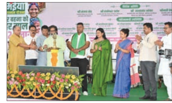
ବନ୍ଧିଆ ଛୋଟାମାଟୁର ପ୍ରମୁଖକର୍ମଧାରୀ ସମ୍ମାନ ଯୋଜନା

ଭୁବନେଶ୍ୱର, ୫/୯/୨୦୨୪: ପ୍ରଧାନମନ୍ତ୍ରୀ ନରେନ୍ଦ୍ର ମୋଦୀ ଏକାଗ୍ର ଐତିହ୍ୟ ପ୍ରକଳ୍ପ କାର୍ଯ୍ୟର ଅଗ୍ରଗତି ସମୀକ୍ଷା କରିଛନ୍ତି।