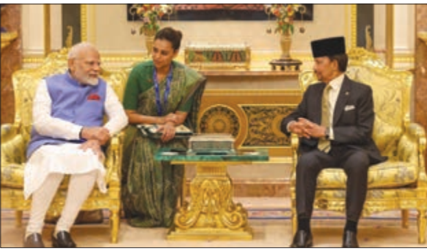
ଦୃଢ଼ ହେବ ଆକୁ ଲକ୍ଷ ପଲିସି