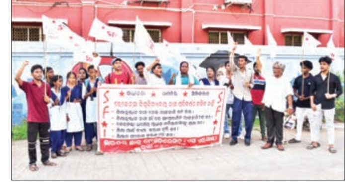
ଟି.ଇ. ରେଭେନ୍ସା ନାମରେ ୧୮୬୮ ମସିହାରେ ପ୍ରତିଷ୍ଠିତ ଏହି ପୁରୁଣା ଶିକ୍ଷାନୁଷ୍ଠାନ ଓଡ଼ିଶାର ଅନେକ ରାଜନୈତିକ ଓ ସାଂସ୍କୃତିକ ଇତିହାସର ମୁକ୍ତସାକ୍ଷୀ । ରେଭେନ୍ସା ବିଶ୍ୱବିଦ୍ୟାଳୟ ନାମ ପଛରେ ବହୁ ଐତିହ୍ୟ ଓ ଗୌରବ ରହିଛି । ଓଡ଼ିଶାରେ ଆଧୁନିକ ଶିକ୍ଷା

ପୁରୀ, ୪।୯/ଏନ୍-ଏନ୍-ଏ: କିଛିଦିନ ତଳେ ରେଭେନ୍ସା ବିଶ୍ୱବିଦ୍ୟାଳୟ ନାମ ପରିବର୍ତ୍ତନ ପାଇଁ କେନ୍ଦ୍ର ଶିକ୍ଷା ମନ୍ତ୍ରୀ ଧର୍ମେନ୍ଦ୍ର ପ୍ରଧାନ ଦେଇଥିବା ପ୍ରସ୍ତାବକୁ ବିରୋଧ କରି ଛାତ୍ର ସଙ୍ଗଠନ ପକ୍ଷରୁ ପୁରୀ ସାମ୍ବାଦିକ ଶେଖର ମହାବିଦ୍ୟାଳୟ ସମ୍ମୁଖରେ ଏକ ବିକ୍ଷୋଭ ଓ ପ୍ରତିବାଦ ସଭା ଅନୁଷ୍ଠିତ ହୋଇଥିଲା । ଏହା ଅତ୍ୟନ୍ତ ଦୁର୍ଭାଗ୍ୟଜନକ ଓ ଏହା ପଛରେ ସାମ୍ବାଦିକ ଓ ଫଣ୍ଡାମେଣ୍ଟାଲ ବିରୋଧୀ ମନୋଭାବ ସ୍ପଷ୍ଟ ବୋଲି ଭାରତର ଛାତ୍ର ଫେଡେରେସନ୍ ପକ୍ଷରୁ କୁହାଯାଇଛି । ଅତୀତରେ କେନ୍ଦ୍ର ସରକାର ଯେପରି ସାମ୍ବାଦିକ ମନୋଭାବ ରଖି ଅନେକ ସହର ଓ ବ୍ଲୋକ୍ସରେ ନାମ ପରିବର୍ତ୍ତନ କରି ଦେଶରେ ହିନ୍ଦୁ ମୁସଲମାନ ମଧ୍ୟରେ ବିଦ୍ୱେଷ ସୃଷ୍ଟି କରିଛନ୍ତି, ଓଡ଼ିଶାରେ କେନ୍ଦ୍ରମନ୍ତ୍ରୀ ସେହି ଧରଣର ପ୍ରୟାସ କରୁଛନ୍ତି ବୋଲି ଏସ୍ଏଫ୍ଆଇ ଅଭିଯୋଗ କରିଛି ।