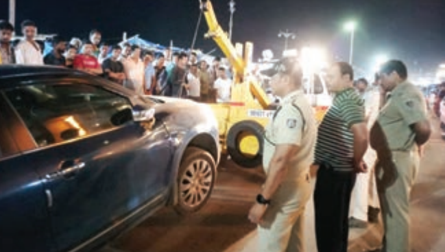
ବେଆଇନ ପାର୍କିଙ୍ଗ୍ ରୋକିବା ପାଇଁ ପୁଲିସ୍ ପକ୍ଷରୁ ପ୍ରୟାସ ଆରମ୍ଭ ହୋଇଛି । ଗୁରୁତ୍ୱପୂର୍ଣ୍ଣ ଆସୁଥିବା ପର୍ଯ୍ୟଟକମାନେ ସେପରି କୌଣସି ଅସୁବିଧାର ସମ୍ମୁଖେ ନହେବେ ସେ ନେଇ ତତ୍ପର ହୋଇଛି ପୁରୀ ପୁଲିସ୍ ପ୍ରଶାସନ ।

ପୁରୀ, ୪।୯/ଏନ୍-ଏନ୍-ଏ: ବିଶ୍ୱ ମାନଚିତ୍ରରେ ଶ୍ରୀକ୍ଷେତ୍ର ପରିଚୟ ହେଉଛନ୍ତି ମହାପ୍ରଭୁ ଜଗନ୍ନାଥ । ସେହି ମହାପ୍ରଭୁଙ୍କୁ ଦର୍ଶନ କରିବା ପାଇଁ ଶ୍ରୀକ୍ଷେତ୍ରକୁ ପର୍ଯ୍ୟଟକଙ୍କ ସୁଅ ଛୁଇଁଛି । ଦୈନିକ ପ୍ରାୟ ୩୦ହଜାରରୁ ଅଧିକ ପର୍ଯ୍ୟଟକ ଓ ଭକ୍ତ ଶ୍ରୀକ୍ଷେତ୍ରକୁ ଆସୁଛନ୍ତି । ପ୍ରାୟତଃ ପ୍ରଥମେ ମହାପ୍ରଭୁଙ୍କୁ ଦର୍ଶନ ସାରିବା ପରେ ପୁରୀର ସ୍ୱର୍ଣ୍ଣ ବେଲଭୂମିର ମଜା ଉଠାଇବା ପାଇଁ ପର୍ଯ୍ୟଟକ ପୁରୀ ଆସୁଛନ୍ତି । ସେତିକି ସହରରେ ପର୍ଯ୍ୟଟକଙ୍କ ଫଣ୍ଡା ବହୁଛି ସେତିକି ଗ୍ରାଫିକ୍ ସମସ୍ୟା ମଧ୍ୟ ବହୁଛି । ଅନେକ ସମୟରେ ପର୍ଯ୍ୟଟକମାନେ ଗାଡ଼ି ପାର୍କିଙ୍ଗ୍ ନେଇ ହଇଜା ହରକତ ହୋଇଛନ୍ତି । ବିଶେଷକରି ଛୁଟି ଦିନଗୁଡ଼ିକରେ ବେଲଭୂମି ମାର୍ଗରେ ଗ୍ରାଫିକ୍ ଜାମ୍ ସମସ୍ୟା ଦେଖିବାକୁ ମିଳୁଛି । ସମ୍ପ୍ରତି ପୁରୀକୁ ବୁଲିବାକୁ ଆସୁଥିବା ପର୍ଯ୍ୟଟକମାନେ ସେପରି କୌଣସି ଅସୁବିଧାର ସମ୍ମୁଖେ ନହେବେ ସେ ନେଇ ତତ୍ପର ହୋଇଛି ପୁରୀ ପୁଲିସ୍ ପ୍ରଶାସନ ।